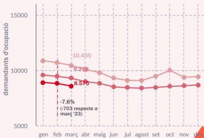
Evolució mensual del nombre de demandants d'ocupació a la Marina Alta