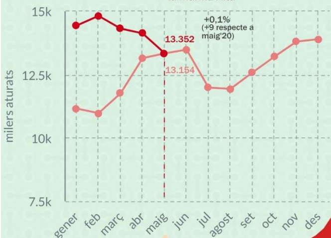
Evolució mensual del núm. de demandants d'ocupació a la Marina Alta