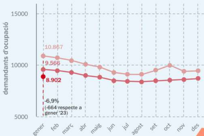
Evolució mensual del nombre de demandants d'ocupació en la Marina Alta