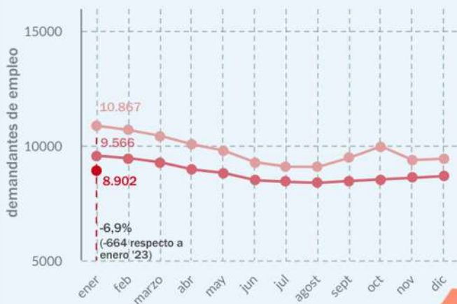
Evolución mensual del núm. de demandantes de empleo en la Marina Alta