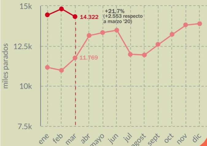
Evolución mensual del nº de demandantes de empleo en la Marina Alta